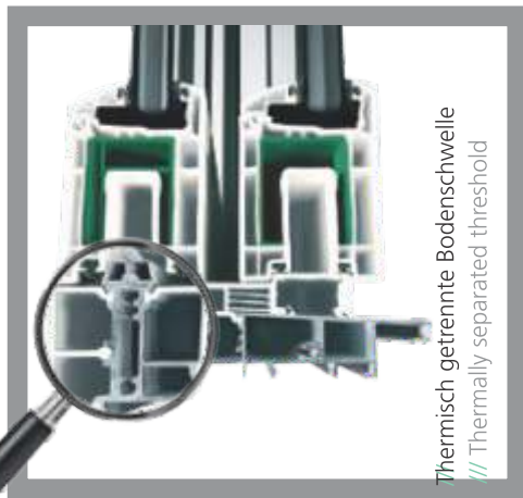
Thermisch getrennte Bodenschwelle /// Thermally separated threshold