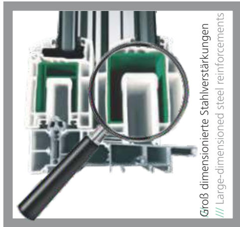
Groß dimensionierte Stahlverstärkungen /// Large-dimensioned steel reinforcements