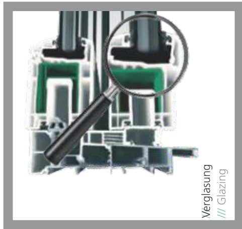
Verglasung /// Glazing